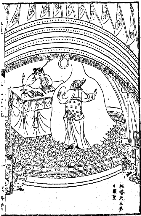
托塔天王夢 4 顯聖